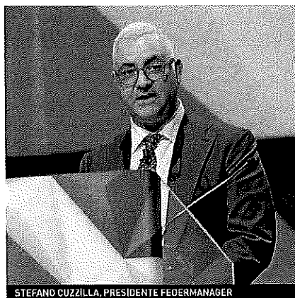
STEFANO CUZZILLA, PRESIDENTE FEDERMANAGER

Quello che emerge in modo evidente dallo studio è che se gli over 50, specie se in posizioni apicali, hanno una migliore preparazione professionale, una visione strategica più completa e maggiore sensibilità quando si parla degli interessi aziendali, le figure junior hanno mediamente un livello d'istruzione più elevato e mostrano competenze tecnologiche decisamente più avanzate. Non solo, appare lampante che i manager over 50, che pure hanno di fronte a loro ancora una ventina d'anni di carriera, devono sviluppare una serie di soft skill che oggi sono prevalentemente appannaggio delle